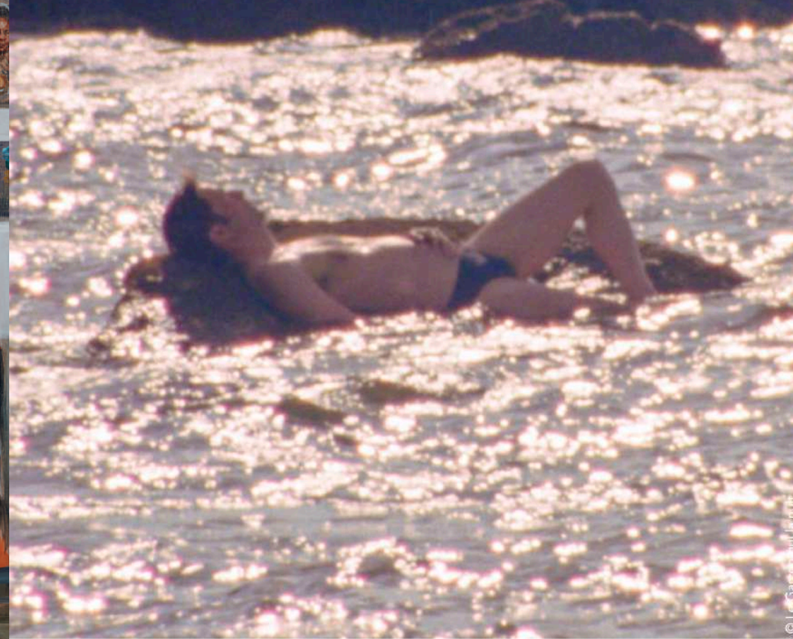
© Les Gaiety / Art / Art / Art

13 e festival du film queer de Cannes 9>12 octobre 2024