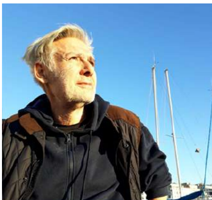
Le cinéaste Lionel Soukaz