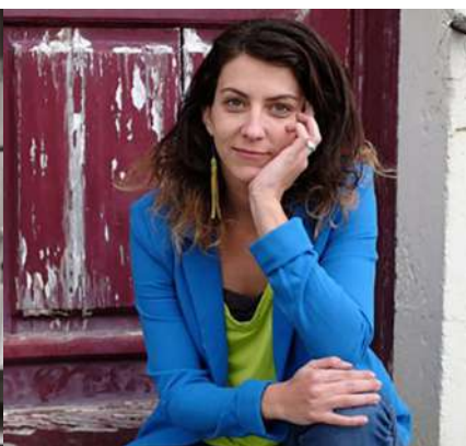
La cinéaste Isabelle Solas