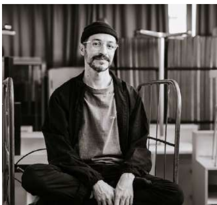
L'artiste André Uerba